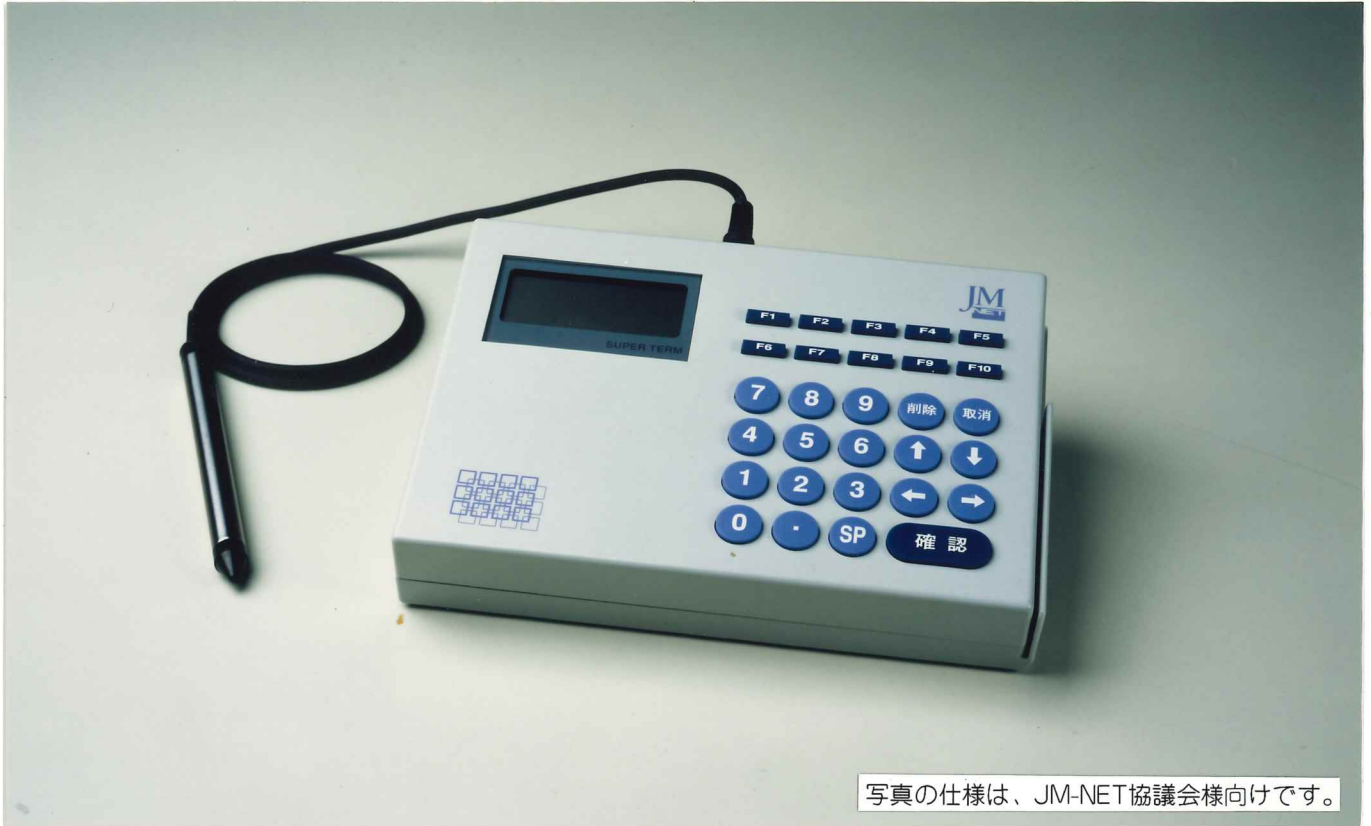
写真の仕様は、JM-NET協議会様向けです。