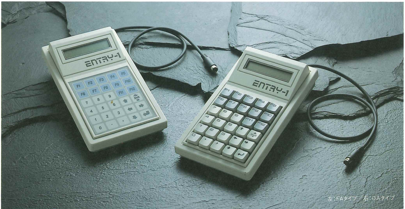
左:FAタイプ 右:OAタイプ