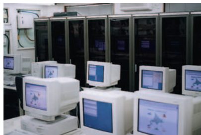
当時のネットワーク設備

パソコン教室は、白糠町民向けに開始されたが、近隣市町村からも多数の参加が続いた。そして変化が起きたのだ。